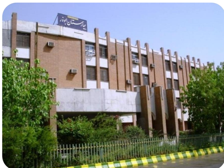
ساختمان قدیمی بیمارستان ابوذر