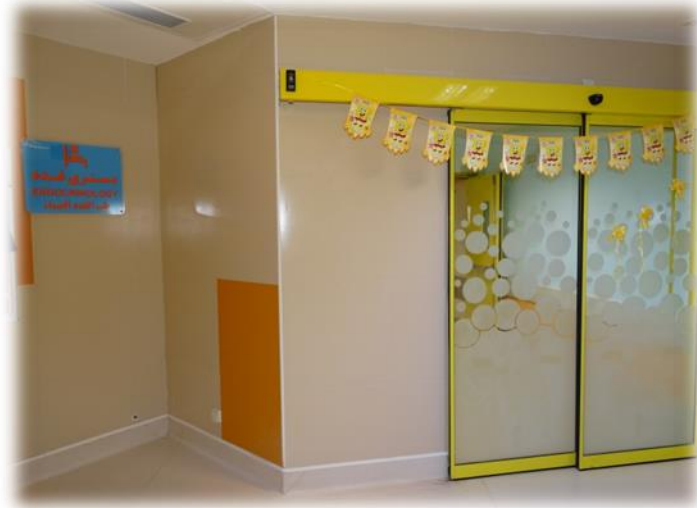
فوق تخصص در حال فعالیت می باشد .

در حال حاضر بخش غدد و گوارش از هم تفکیک گردیده و بخش گوارش در طبقه چهارم با ۱۸ تخت در حال فعالیت می باشد.