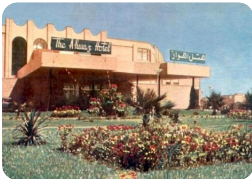
ساختمان ابتدایی بیمارستان ابوذر ( هتل اهواز )